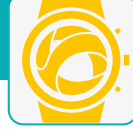
APP MySNS TEMPOS